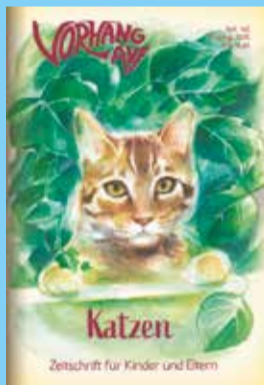
Vorhang auf Katzen