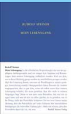
Rudolf Steiner Mein Lebensgang