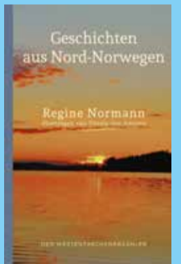
Regine Normann Geschichten aus Nord-Norwegen